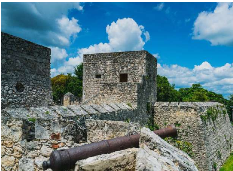
Tabla 3. Aseo.