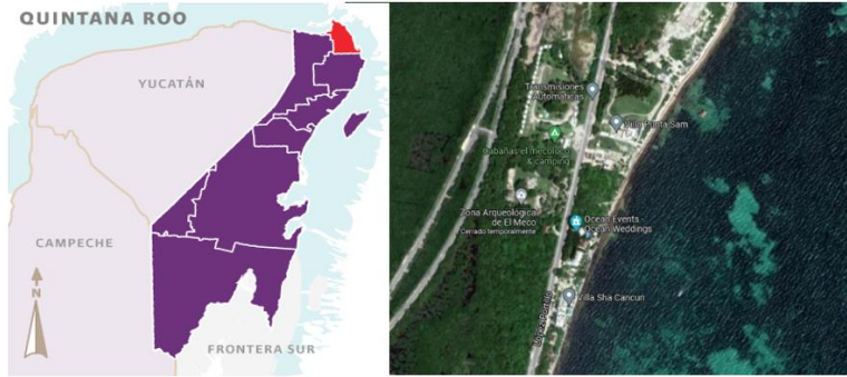
Ilustración 1. Mapa de Quintana Roo (H. Ayuntamientos de Isla Mujeres, 2021) / Mapa ubicación El meco, Isla Mujeres (Google Maps, 2021)