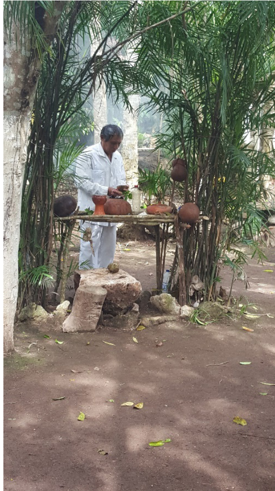
Figura 2. Preparación de la ceremonia maya en la comunidad Campamento Hidalgo

Hoy es el turismo, previamente lo que se sembraba aquí, cuando se hace la milpa, se hace el maíz, calabaza, el frijol, el camote. Muchos siembran camote, jícama, ibes, todo lo que se pone en la tierra da. Pero los tiempos ya no son como antes, definitivamente el tiempo ya cambió, si siembras el maíz con trabajo da, entonces ya no alcanza para sostenerse [...] El turismo es lo que está dejando ahorita, mucha gente dejó de hacer, de trabajar en el campo y mucha gente trabaja semanal en el turismo (Entrevista 3).