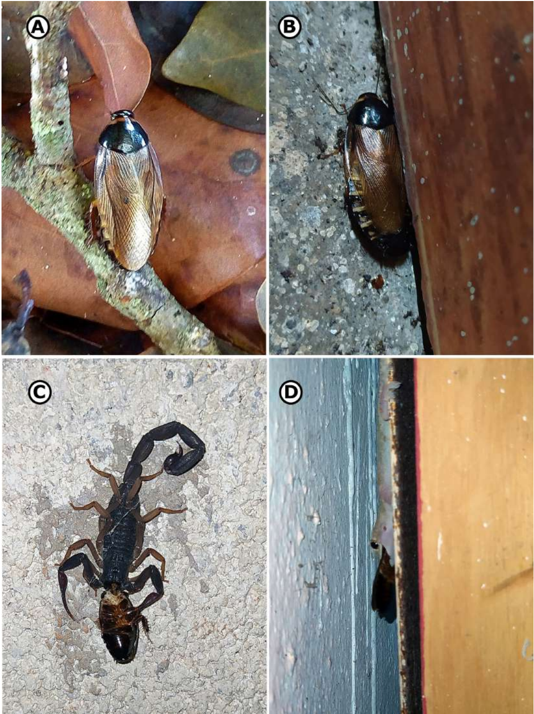
Figura 2. Pycnoscelus surinamensis en vida libre e interacciones. A. Ejemplar adulto en jardines de ECOSUR Unidad Chetumal, peridomiciliar. B. Ejemplar adulto en casa-habitación de la localidad de Calderitas, peridomiciliar. C. Ejemplar consumido por el escorpión Centruroides gracilis . D. Ejemplar consumido por el gecko Hemidactylus frenatus . / Pycnoscelus surinamensis in free-living and trophic interactions. A. Adult specimen in gardens of ECOSUR Unidad Chetumal, peridomiciliary. B. Adult specimen in a house in the town of Calderitas, peridomiciliary. C. Specimen consumed by the scorpion Centruroides gracilis . D. Specimen consumed by the gecko Hemidactylus frenatus .