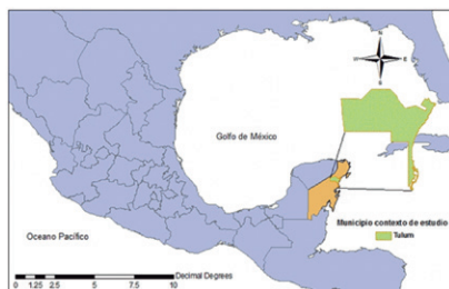
Figura 1: Mapa de localización Quinta Roo