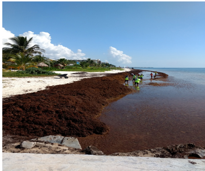
Figura 2. Acumulación de sargazo en la playa y «marea marrón»

Por otra parte, que se descomponga el sargazo en la playa produce gran cantidad de materia orgánica que, por acción del oleaje, llega al mar. Ello provoca que el agua se torne turbia y color café formando lo que se ha llamado «marea marrón del sargazo» (figura 2). Esta marea puede extenderse por cientos de metros, deteriorando la calidad del agua, al aumentar los niveles de nitratos, fosfatos, sulfuros y sales de amonio, y disminuir el paso de la luz y la concentración de oxígeno (Van Tussenbroek et al. , 2017; Rodríguez-Martínez et al. , 2019).