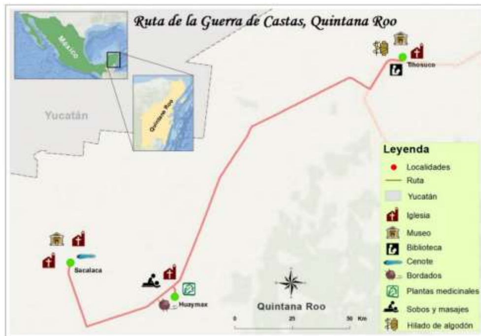
Figura 2. Mapa de recursos turísticos de la Ruta de La Guerra de Castas (elaboración: Robertos, 2018).

Siguiendo las investigaciones previas, el trabajo ha continuado centrándose en tres de las comunidades que conforman el área maya y que son las que, de momento, configuran la ruta, dos de ellas, Sacalaca y Huay Max, pertenecientes al municipio de José María Morelos y Tihosuco al municipio de Felipe Carrillo Puerto, del Estado de Quintana Roo, que fueron georeferenciados y se subió a una base de datos procesada con el Sistema de Información Geográfica (Figura 2, Anexo 2).