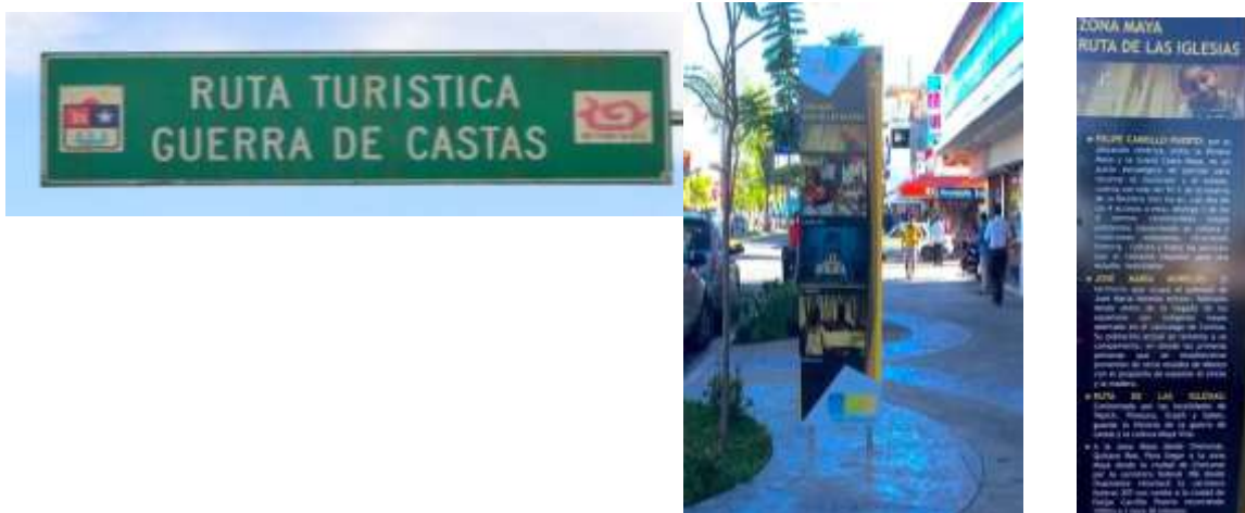
Figura 4. Letrero de la guerra de castas ubicado en la carretera Valladolid- Felipe Carrillo Puerto (García, 2016) y de la ruta de las iglesias en la ciudad de Chetumal, Quintana Roo.

Se identificó que a nivel de carretera federal como estatal no se cuenta con un número importante de señalamientos como referencia para llegar a las localidades que conforman la ruta (Figura 4). En total se encontraron cinco señalamientos, de los cuales tres indicativos para llegar a Tihosuco, dos de ellos se ubican en la carretera Muna-Felipe Carrillo Puerto y uno en la carretera Valladolid-Felipe Carrillo Puerto. Chiclin (2017) resalta que estos tramos carreteros son importantes ya que son paso de visitantes que se dirigen desde Mérida a destinos del sur de Quintana Roo como Bacalar, Chetumal o de Valladolid a Felipe Carrillo Puerto con destino a Chetumal, o Riviera Maya, por su parte, para llegar a las localidades de Sacalaca o Huay Max la señalética solo se ubica en la carretera estatal Dziuché-Tihosuco.