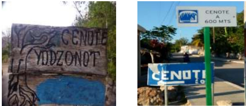
Figura 5. Letreros de señalamiento interno de los recursos de la RGC.

En lo que respecta a la señalética de ubicación o informativas, se encontró que no se cuenta con la suficiente para que los turistas que visitan la ruta identifiquen los servicios o atractivos turísticos ofertados. Se cuenta con diez señaléticas, la mayoría elaborada con distintos materiales como manta, lona, y madera, ubicadas en el sitio o atractivo y otras en el centro de la localidad (Figura 5).