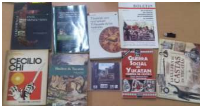
Figura 3. Material bibliográfico en las comunidades (elaboración: propia).

En la Universidad Intercultural Maya de Quintana Roo, se encontró el registro de dos libros y 18 tesis del año 2011 a 2017. La importancia de conocer que información se tiene y donde consultarla, radica en que estos datos nos permitirán elaborar guiones interpretativos que incluyan información adecuada al período histórico estudiado (Figura 3).